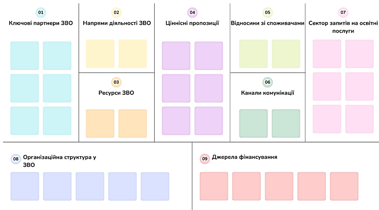
Рис. 2. Схема візуалізації проєкту відповідно до технології «Business model Canvas»

Висновки з дослідження і перспективи подальших розвідок у цьому напрямі. Досвід розвинутих держав світу довів, що дійсно ефективною методологією запровадження інновацій є технологія проєктного менеджменту.