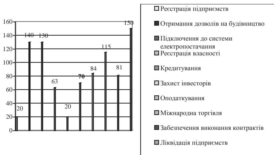
Рис. 3. Показник ведення бізнесу (ПВБ) в Україні за 2017 р.

Основні індикатори даного дослідження за 2017 р. зображено на рис. 3.