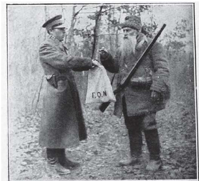
Рис. 2. Передача мисливцем гільз у фонд народної оборони Джерело: [1].

Метал, з якого виготовляли зброю, Польща взагалі не виробляла. Для мисливців це не спричиняло труднощів, оскільки до цього часу всі використані гільзи викидали на смітник або їх збирали хлопці з нагінки, щоб продати браконьерам або торговцям-євреям [1, 65–67]. Останні навіть влаштували собі успішний бізнес: купували всі запропоновані гільзи, сортували відповідно до калібру і продавали. Нова гільза коштувала 15 грошів, а стріляна – лише 2–3 гроші, проте кожна містила 2 грами чистої міді. Якщо рахувати, що в середньому кожен мисливець щороку купує 200 набоїв, а мисливців у Польщі було на той час 50 тис., то вони витрачали 10 млн патронів, тобто 20 т міді [2, 216–218]. Слід додати, у довоєнній Польщі був дуже поширений стрілецький спорт, а на стрільбищах використовували дуже багато набоїв, що становило ще додаткових 50 %.