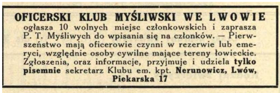
Рис. 1. Оголошення з газети про запрошення військових до мисливського клубу в м. Львів [35, 129]

членів товариства йому було надано в користування мисливські угіддя на території села Бісковичі [37, 90; 38, 84].