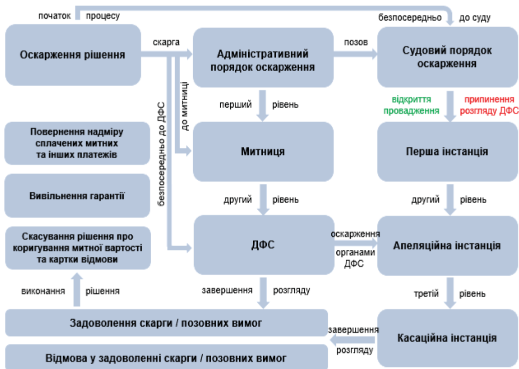
Рис. 2. Схема оскарження рішень про коригування митної вартості товарів

При цьому, якщо рішення, дії або бездіяльність органу доходів і зборів або його посадової особи одночасно оскаржуються до органу (посадової особи) вищого рівня та до суду, суд відкриває провадження у справі, розгляд скарги органом (посадовою особою) вищого рівня припиняється [5, ч. II ст. 29]. Отже, законодавство визначає адміністративний та судовий порядок оскарження рішень, дій або бездіяльності органів доходів і зборів. Відповідний процес у загальному вигляді можна зобразити так (рис. 2).