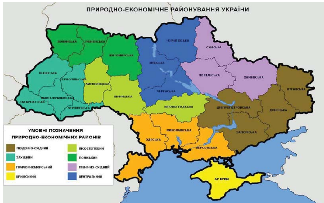
Рис. 2. Аванпроект природно-економічного районування України на основі комплексної оцінки природного багатства держави та її регіонів

підходу. Необхідно зауважити, що господарськими зв'язками економіка Криму нерозривно пов'язана з материковою частиною України і питання скоординованого з Україною використання природних ресурсів (насамперед водних) у будь-якому разі гостро проблематичне для сталого розвитку господарства Криму і потребує узгодження з українською владою.